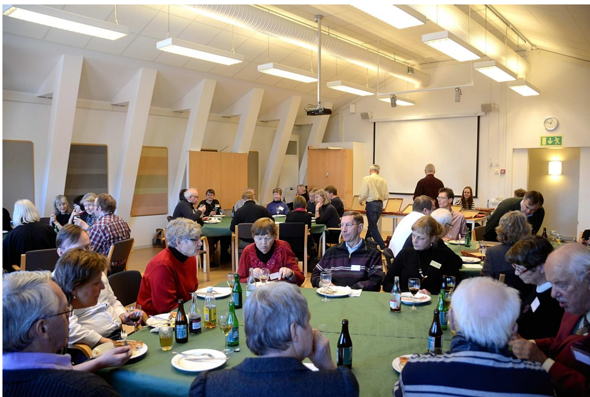
Lunchen intogs i "Kyrkan", som dock inte är någon kyrka utan en samlingsal högst upp i Arkivcentrums byggnad.